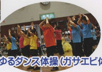
③ゆるダンス体操(ガサエビ体操)