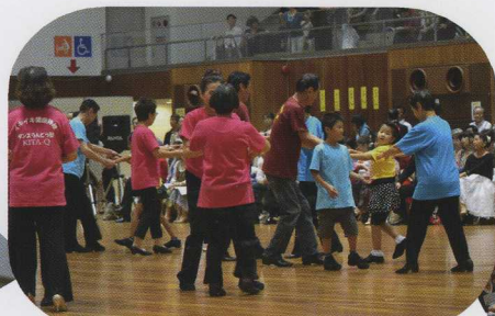
②三世代DUマッチングリーグ