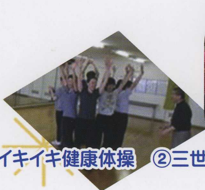
①イキイキ健康体操

そのような環境を創るお手伝いをするのが「ダンスうんどう塾」です。全国の自治体が医療費の増大などにより財源が乏しくなり“負のスパイラル”を続けています。一日でも健康でいることが幸せであり、笑顔でいれて、かつ医療費の削減となります。日本を豊かに・・・文字通り地域再生の原理と考えています。さあ～、始めましょう！ 0才から100才までコミュニケーション・対話の機会として、「健育」を推進し、地域が一体となった、まち育て・ひと育てを実現しましょう。